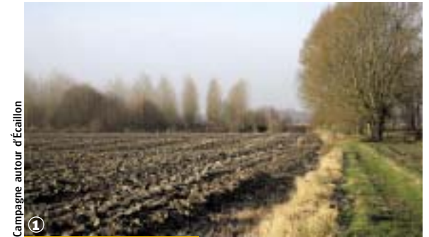
Campagne autour d'Ecaillon

(4,5 km - 1 h 00) / (5,5 km - 1 h 15 à 1 h 50)